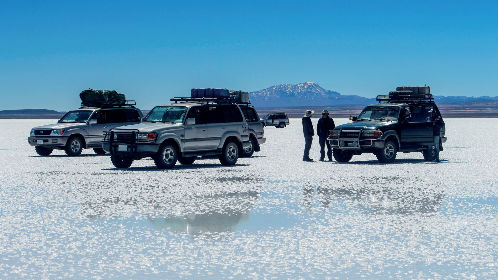
Salar de Uyuni