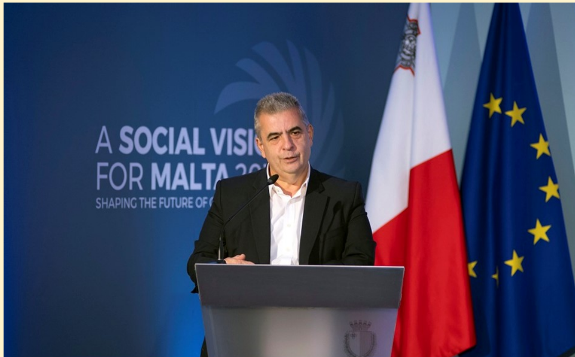
Tonio Bonello Editur FAMILJA

Il-laqgħat ta' qabel il-konsultazzjoni enfasizzaw kif is-servizzi soċjali għandhom ikunu ddisinjati biex jindirizzaw aħjar il-bżonnijiet tan-nies.